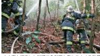
山火事を想定した訓練で急斜面を登り放水する隊員