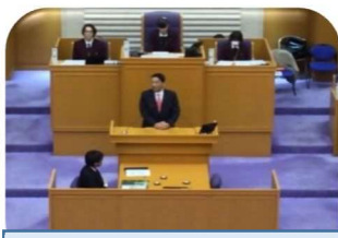
第2部 野田市長からの挨拶