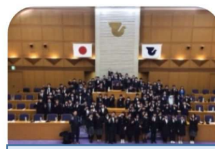
みんなで集合写真!