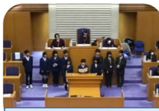
第2部 孔舎衛中学校区の発表