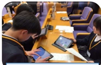
第1部 ワールドカフェの様子

参加した児童生徒からは、「他校の生徒と交流し、取組みを知ることができた。」「議場での発表は緊張した。」「他校の発表を聞くことができて参考になった。」「学んだことを自校の取組みに生かしたい。」などの感想が聞かれました。