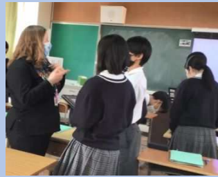
そつきやうてき えいご ちゆうしん 即興的なやりとりを中心と した中学校の授業