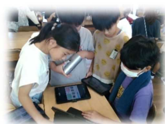
じゅぎょう ようす 授業の様子