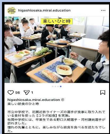
ちゅうがっこう こらぼ しょく 中学校でのコラボ給食