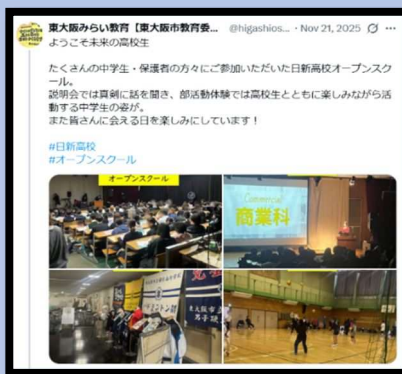
にっしんこうこう おお おん すくうる 日新高校オープンスクール