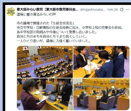
せいとかいこうりゅうかい 生徒会交流会

した ゆうあるえる くりっく にじげんこおど よと 下のURLをクリックするか、二次元コードを読み取ることでアカウントへアクセスできます。