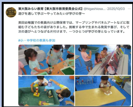
ようちえん あそび とお まな 幼稚園での遊びを通した学び