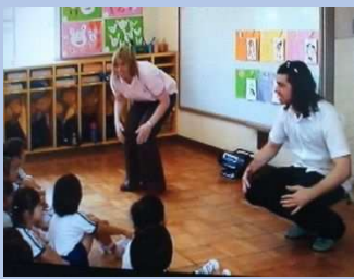
ようちえん えん あそ 幼稚園・こども園での遊び とお こくさいりかい を通した国際理解

ぜんがっこうえん えええるてい いがいこくごしどうこうし ええいいてい えいごしどうじょしゅ はいち えいごきょういく 全学校園に「ALT (外国語指導講師)」や「AET (英語指導助手)」を配置し、英語教育 を推進しています。英語でやりとりをしたり、英語まつり・英語村等に参加したりするなど、 英語を使って伝え合う活動を通して、異なる文化への理解、コミュニケーション能力の育成を 図っています