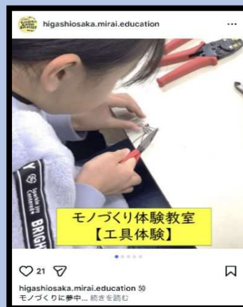
しょうがっこう もの ものづくり たいけんきょうしつ 小学校でのモノづくり体験教室