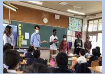
にん えええるてい えいご きまぎま 5人のALTと英語で様々な 活動を行う英語村