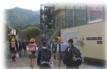
ねんせい ちゅうがっこう とうこう ようす 6年生が中学校へ登校する様子

ちゅうがくしんがくじ こ いだ ふあん かいしょう 中学校進学時に子どもが抱く不安の解消をはかること などを目的に、小学6年生が中学校に登校し、中学校 での生活を体験します。中学校教員の授業や部活動体験 など、中学校区の実態に応じた取組みが実施されています。