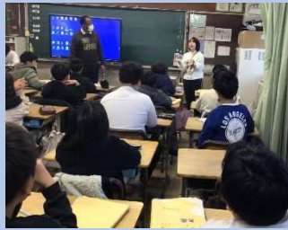
えいご こみゅにけえしよん 英語でのコミュニケーション たの しやうがっこう じゅぎやう を楽しむ小学校の授業